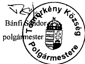
Bánfi Sándor polgármester

A rendelet hatálybalépésével egyidejűleg hatályát veszti a település szilárdhulladékkal kapcsolatos közszolgáltatás kötelező igénybevételeéről szóló 13/2008. (IX.09.) önkormányzati rendelet.